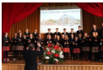
Uroczystości jubileuszowe 130- rocznicy istnienia VIII Liceum Ogólnokształcącego im. Władysława IV w Warszawie