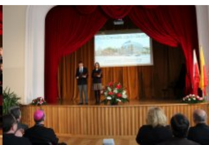
Uroczystości jubileuszowe 130- rocznicy istnienia VIII Liceum Ogólnokształcącego im. Władysława IV w Warszawie