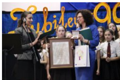
Jubileusz Szkoły Podstawowej nr 50 im. Królowej Jadwigi w Warszawie