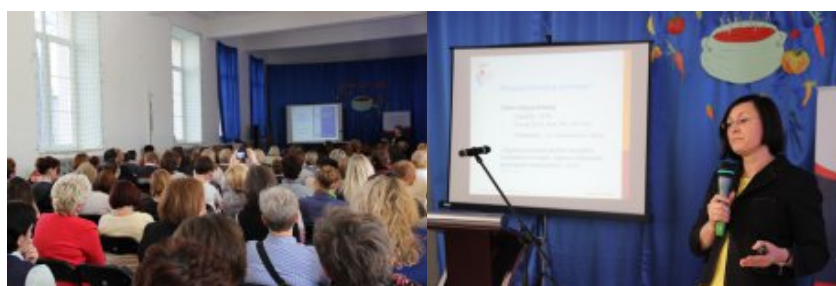
III Wojewódzka Konferencja Szkół Promujących Zdrowie