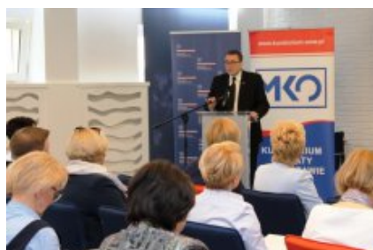
Edukacja dla Polaków na Wschodzie - konferencja