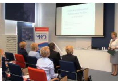
Edukacja dla Polaków na Wschodzie - konferencja