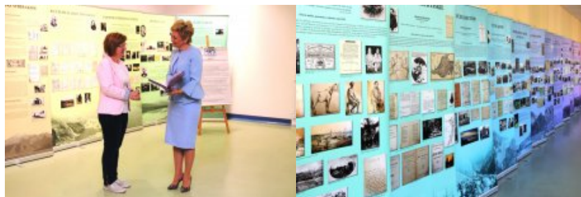
Edukacja dla Polaków na Wschodzie - konferencja