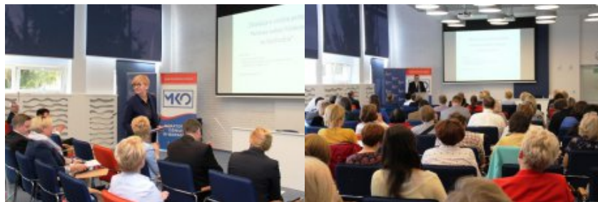
Edukacja dla Polaków na Wschodzie - konferencja