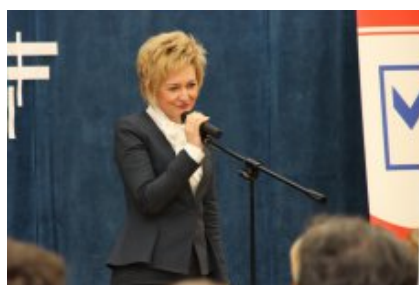
Wielkanocna Akcja Paczka 2018