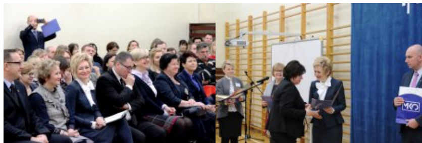
Wielkanocna Akcja Paczka 2018