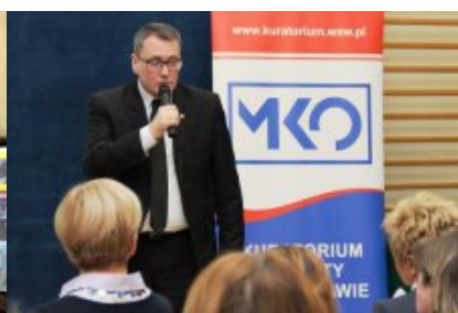
Wielkanocna Akcja Paczka 2018