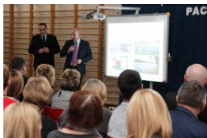
Wielkanocna Akcja Paczka 2018