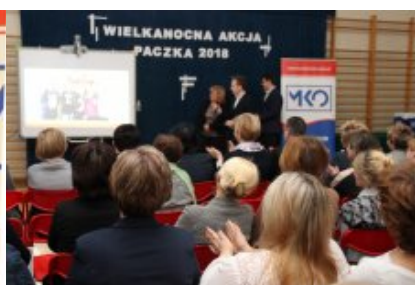
Wielkanocna Akcja Paczka 2018