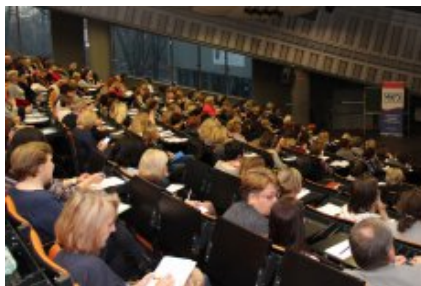
O reformie z nauczycielami z rejonu warszawskiego