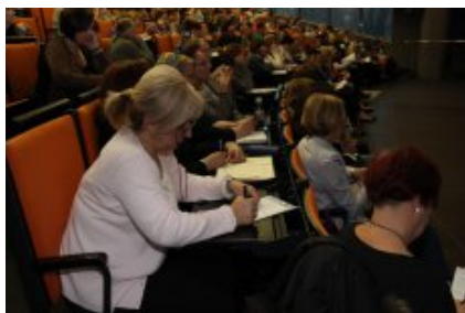
O reformie z nauczycielami z rejonu warszawskiego