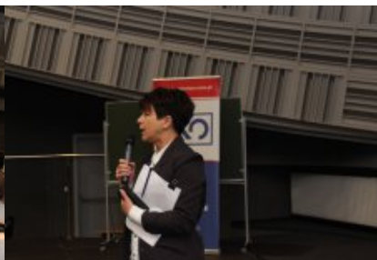
O reformie z nauczycielami z rejonu warszawskiego