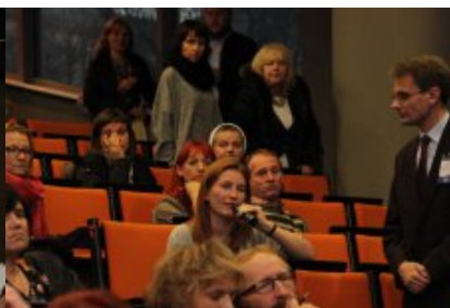
O reformie z nauczycielami z rejonu warszawskiego

Data publikacji 22.11.2016 Data modyfikacji 22.11.2016