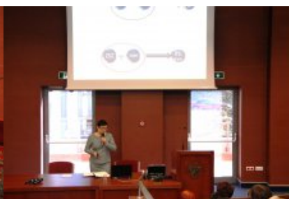
Konferencja dla przedstawicieli samorządów województwa mazowieckiego