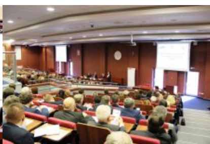
Konferencja dla przedstawicieli samorządów województwa mazowieckiego