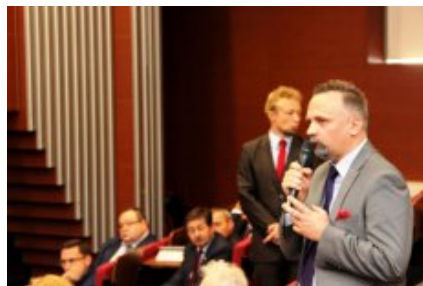
Konferencja dla przedstawicieli samorządów województwa mazowieckiego