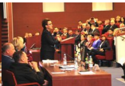
Konferencja dla przedstawicieli samorządów województwa mazowieckiego