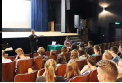
Transplantacje. Dar życia - jestem na tak