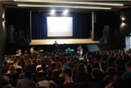
Transplantacje. Dar życia - jestem na tak