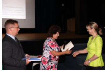
Transplantacje. Dar życia - jestem na tak