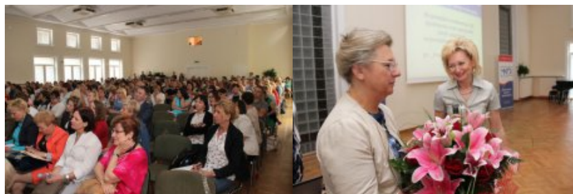
Konferencja "Programowanie w szkole"