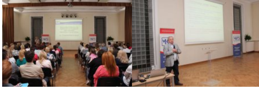
Konferencja "Programowanie w szkole"