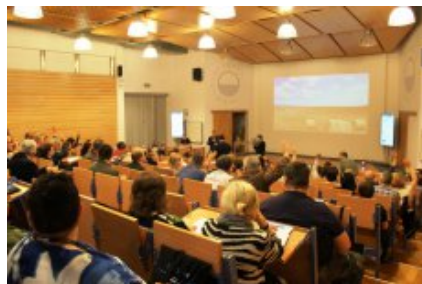
XVI Ogólnopolski Zjazd Opiekunów Szkolnych Pracowni Internetowych