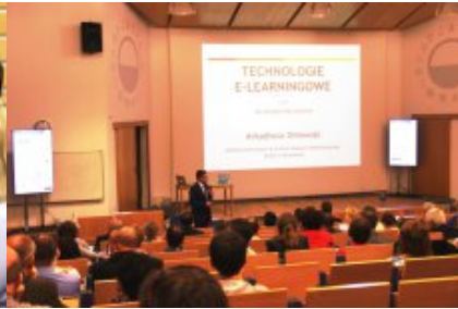
XVI Ogólnopolski Zjazd Opiekunów Szkolnych Pracowni Internetowych