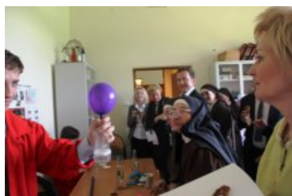
Ośrodek Szkolno-Wychowawczy dla Dzieci Niewidomych im. Róży Czackiej w Laskach - sala do eksperymentów chemicznych oraz fizycznych