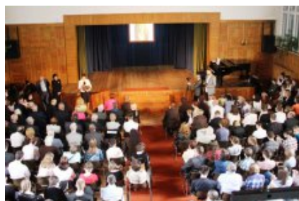
Uroczysta gala w Ośrodku Szkolno-Wychowawczym dla Dzieci Niewidomych im. Róży Czackiej w Laskach