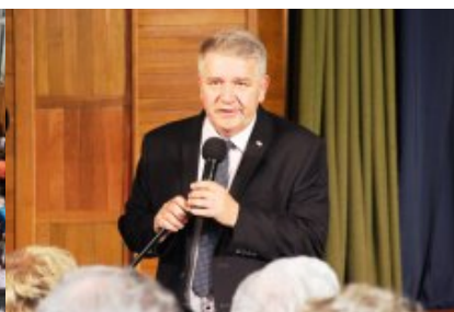
Sylwester Dąbrowski - Wicewojewoda Mazowiecki