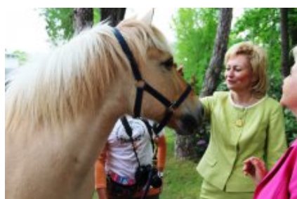
Ośrodek Szkolno-Wychowawczy dla Dzieci Niewidomych im. Róży