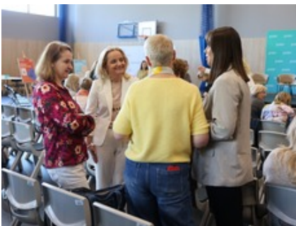
28.04.2026 r. Reforma26. Kompas Jutra w Warszawie 13