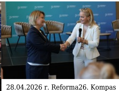
28.04.2026 r. Reforma26. Kompas Jutra w Warszawie 11