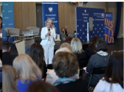
28.04.2026 r. Reforma26. Kompas Jutra w Warszawie 16