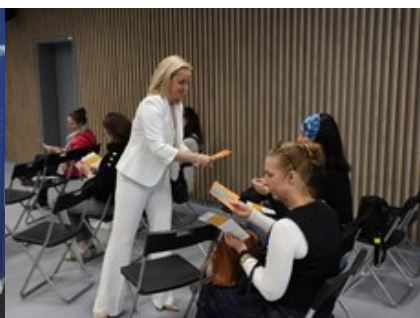
28.04.2026 r. Reforma26. Kompas Jutra w Warszawie 26