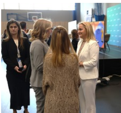
28.04.2026 r. Reforma26. Kompas Jutra w Warszawie 25