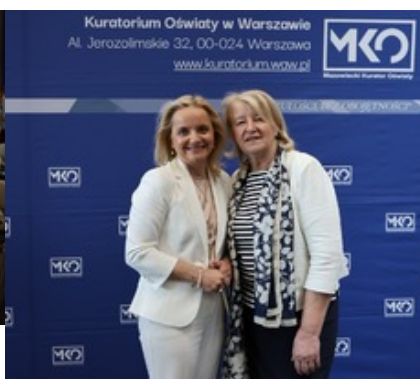
28.04.2026 r. Reforma26. Kompas Jutra w Warszawie 23