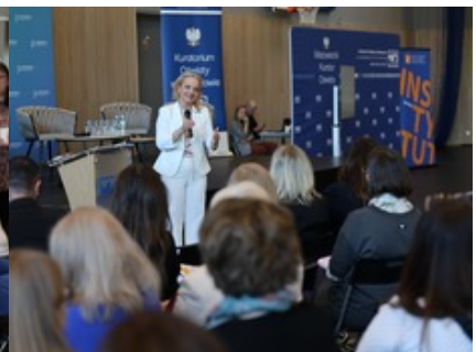
28.04.2026 r. Reforma26. Kompas Jutra w Warszawie 16