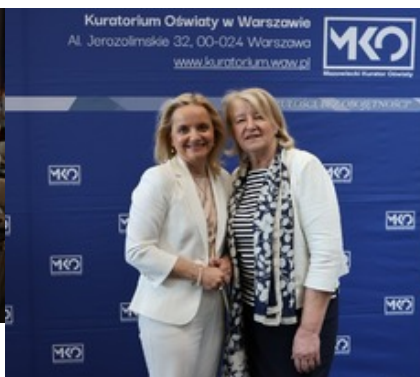
28.04.2026 r. Reforma26. Kompas Jutra w Warszawie 23