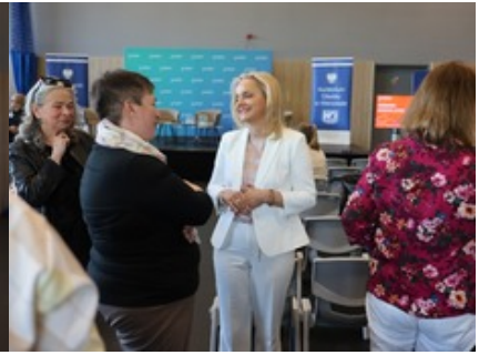
28.04.2026 r. Reforma26. Kompas Jutra w Warszawie 9