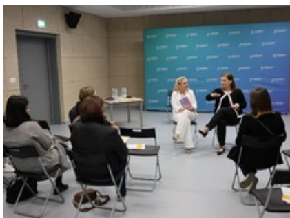
28.04.2026 r. Reforma26. Kompas Jutra w Warszawie 28