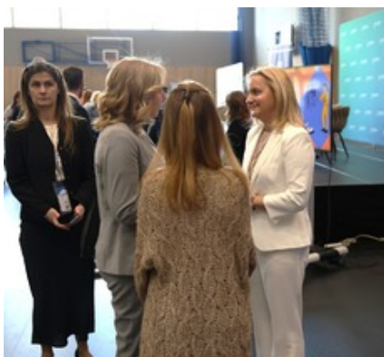
28.04.2026 r. Reforma26. Kompas Jutra w Warszawie 25