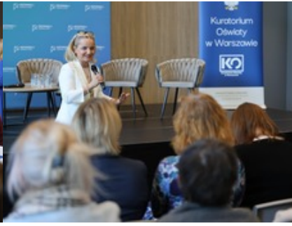
28.04.2026 r. Reforma26. Kompas Jutra w Warszawie 5