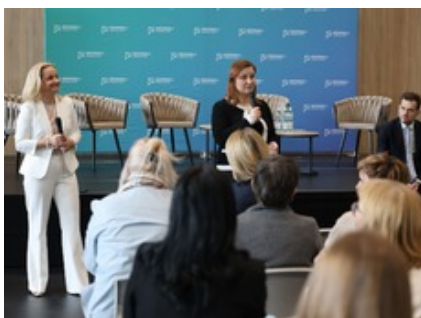
28.04.2026 r. Reforma26. Kompas Jutra w Warszawie 21