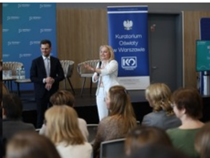
28.04.2026 r. Reforma26. Kompas Jutra w Warszawie 20