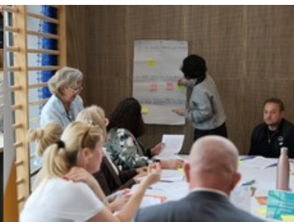
28.04.2026 r. Reforma26. Kompas Jutra w Warszawie 29