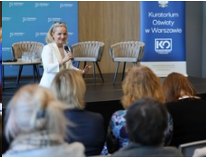
28.04.2026 r. Reforma26. Kompas Jutra w Warszawie 5