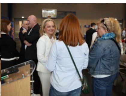
28.04.2026 r. Reforma26. Kompas Jutra w Warszawie 22