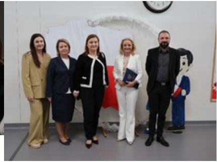
28.04.2026 r. Reforma26. Kompas Jutra w Warszawie 34