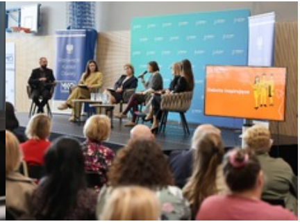
28.04.2026 r. Reforma26. Kompas Jutra w Warszawie 6