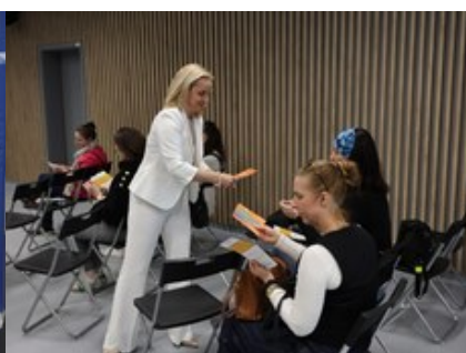
28.04.2026 r. Reforma26. Kompas Jutra w Warszawie 26