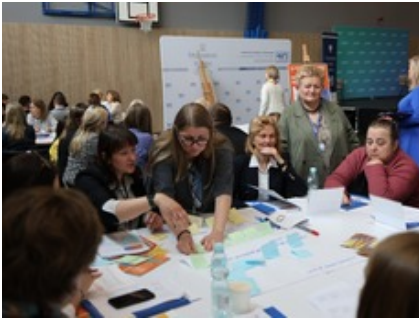
28.04.2026 r. Reforma26. Kompas Jutra w Warszawie 4