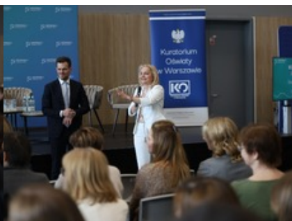
28.04.2026 r. Reforma26. Kompas Jutra w Warszawie 20