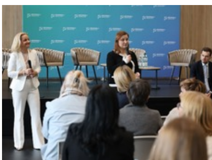
28.04.2026 r. Reforma26. Kompas Jutra w Warszawie 21