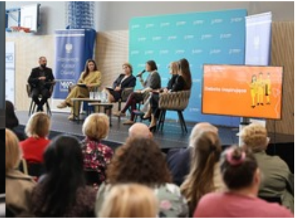
28.04.2026 r. Reforma26. Kompas Jutra w Warszawie 6