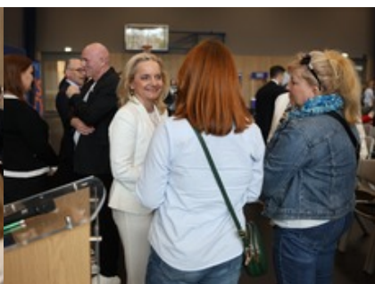
28.04.2026 r. Reforma26. Kompas Jutra w Warszawie 22