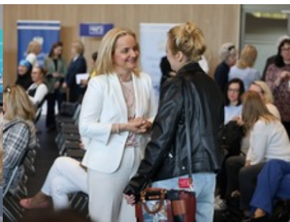
28.04.2026 r. Reforma26. Kompas Jutra w Warszawie 15