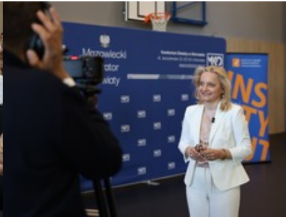
28.04.2026 r. Reforma26. Kompas Jutra w Warszawie 8