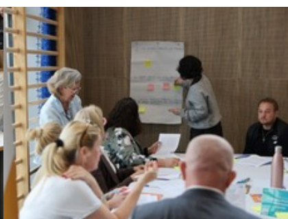
28.04.2026 r. Reforma26. Kompas Jutra w Warszawie 29