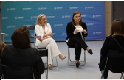
28.04.2026 r. Reforma26. Kompas Jutra w Warszawie 33