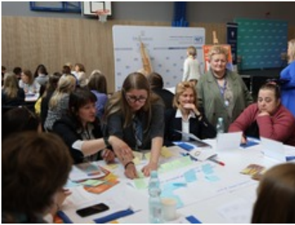
28.04.2026 r. Reforma26. Kompas Jutra w Warszawie 4