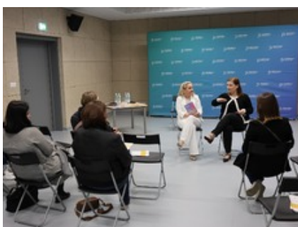
28.04.2026 r. Reforma26. Kompas Jutra w Warszawie 28