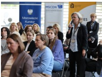
28.04.2026 r. Reforma26. Kompas Jutra w Warszawie 18