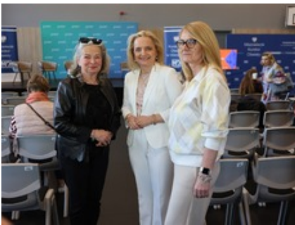
28.04.2026 r. Reforma26. Kompas Jutra w Warszawie 10