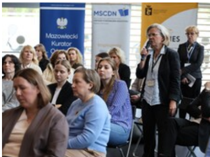
28.04.2026 r. Reforma26. Kompas Jutra w Warszawie 18