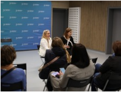
28.04.2026 r. Reforma26. Kompas Jutra w Warszawie 32