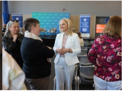
28.04.2026 r. Reforma26. Kompas Jutra w Warszawie 9