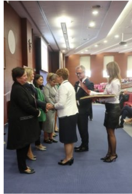
Obchody Dnia Edukacji Narodowej na Mazowszu