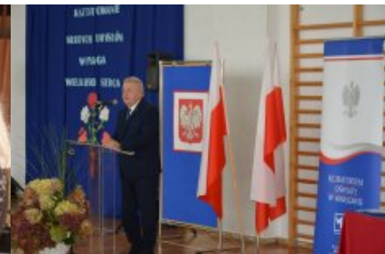
Obchody Dnia Edukacji Narodowej na Mazowszu