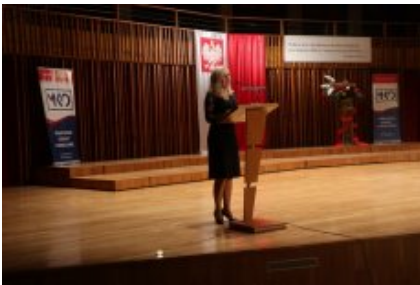
Obchody Dnia Edukacji Narodowej na Mazowszu