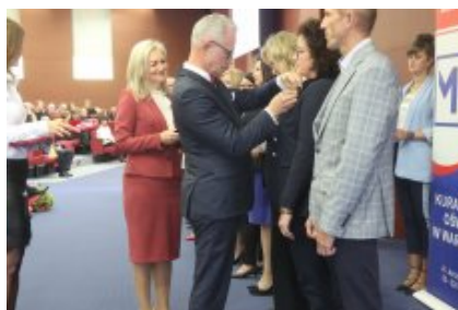
Obchody Dnia Edukacji Narodowej na Mazowszu