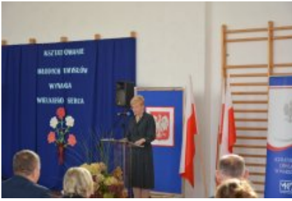
Obchody Dnia Edukacji Narodowej na Mazowszu