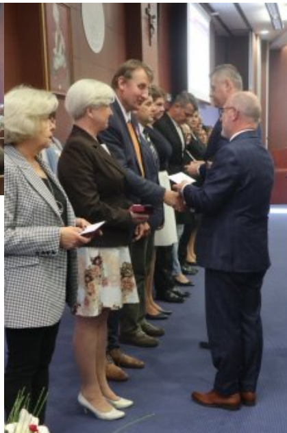
Obchody Dnia Edukacji Narodowej na Mazowszu