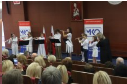
Obchody Dnia Edukacji Narodowej na Mazowszu