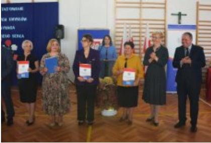
Obchody Dnia Edukacji Narodowej na Mazowszu