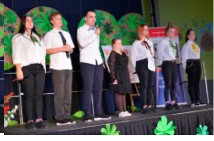
Obchody Dnia Edukacji Narodowej na Mazowszu