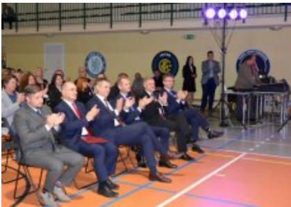
Obchody Dnia Edukacji Narodowej na Mazowszu