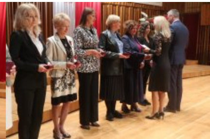
Obchody Dnia Edukacji Narodowej na Mazowszu