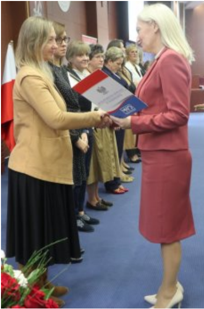
Obchody Dnia Edukacji Narodowej na Mazowszu