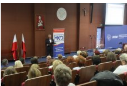
Obchody Dnia Edukacji Narodowej na Mazowszu

Podczas obchodów Dnia Edukacji Narodowej odznaczeniami państwowymi, resortowymi, nagrodami Ministra Edukacji i Nauki oraz nagrodami Mazowieckiego Kuratora Oświaty uhonorowano łącznie 204 nauczycieli i pracowników oświaty.