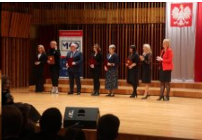
Obchody Dnia Edukacji Narodowej na Mazowszu