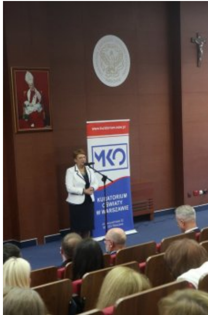
Obchody Dnia Edukacji Narodowej na Mazowszu