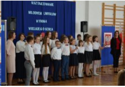
Obchody Dnia Edukacji Narodowej na Mazowszu