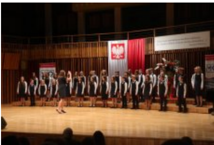
Obchody Dnia Edukacji Narodowej na Mazowszu