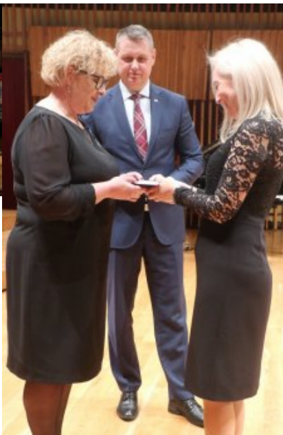
Obchody Dnia Edukacji Narodowej na Mazowszu