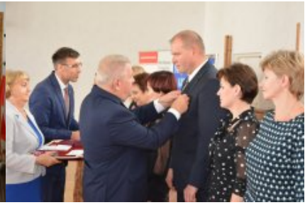
Obchody Dnia Edukacji Narodowej na Mazowszu