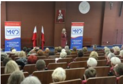
Obchody Dnia Edukacji Narodowej na Mazowszu