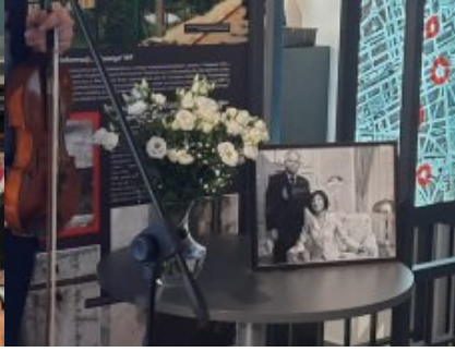
Podsumowano konkurs „Lech Kaczyński - mąż stanu”