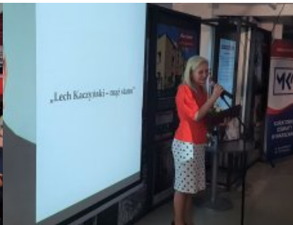
Podsumowano konkurs „Lech Kaczyński - mąż stanu”