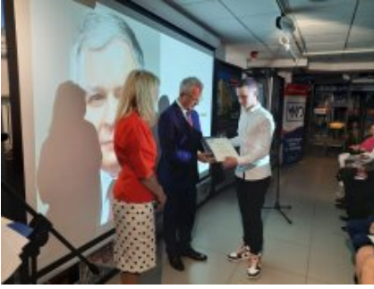
Podsumowano konkurs „Lech Kaczyński - mąż stanu”