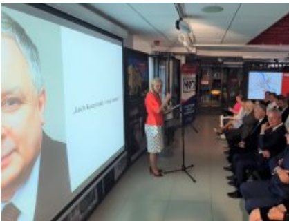
Podsumowano konkurs „Lech Kaczyński - mąż stanu”