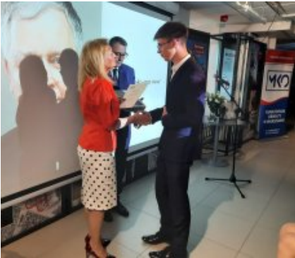
Podsumowano konkurs „Lech Kaczyński - mąż stanu”