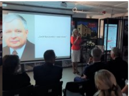
Podsumowano konkurs „Lech Kaczyński - mąż stanu”