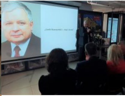
Podsumowano konkurs „Lech Kaczyński - mąż stanu”