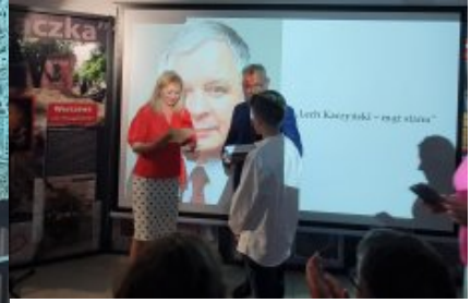
Podsumowano konkurs „Lech Kaczyński - mąż stanu”