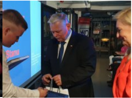
Podsumowano konkurs „Lech Kaczyński - mąż stanu”