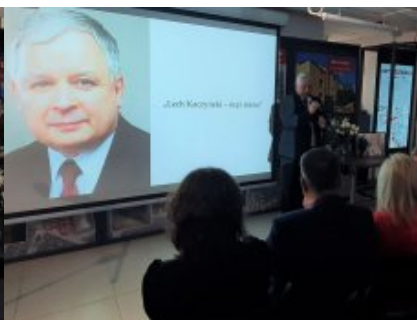
Podsumowano konkurs „Lech Kaczyński - mąż stanu”