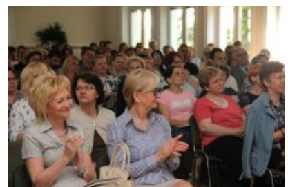
Konferencja "Programowanie w szkole"