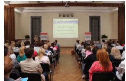
Konferencja "Programowanie w szkole"