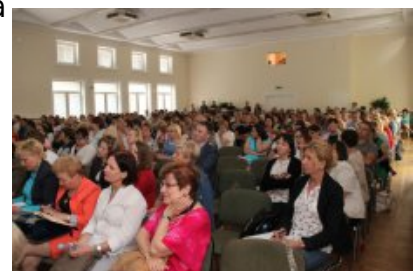
Konferencja "Programowanie w szkole"