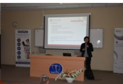
Konferencja w Siedlcach