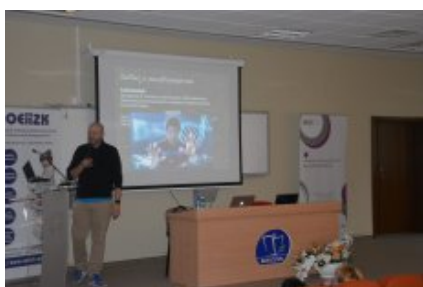
Konferencja w Siedlcach