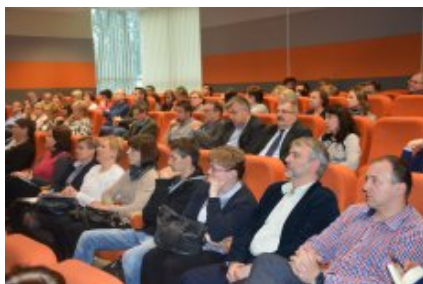
Konferencja w Siedlcach