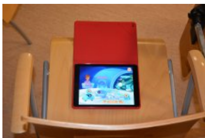
Konferencja w Siedlcach