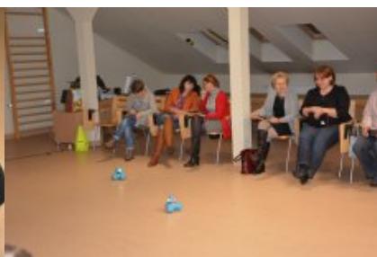
Konferencja w Siedlcach