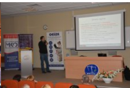
Konferencja w Siedlcach