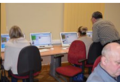
Konferencja w Siedlcach