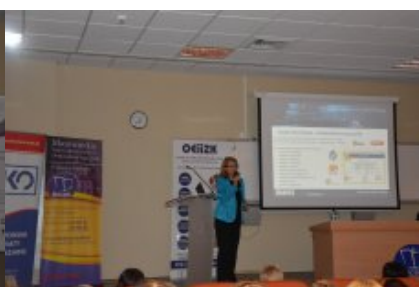
Konferencja w Siedlcach