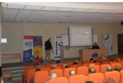
Konferencja w Siedlcach