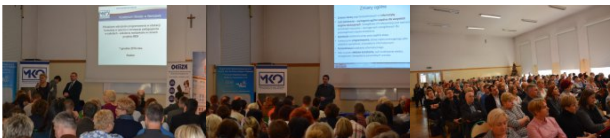
O programowaniu w szkołach w Radomiu