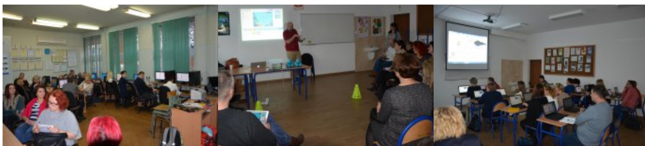
O programowaniu w szkołach w Radomiu