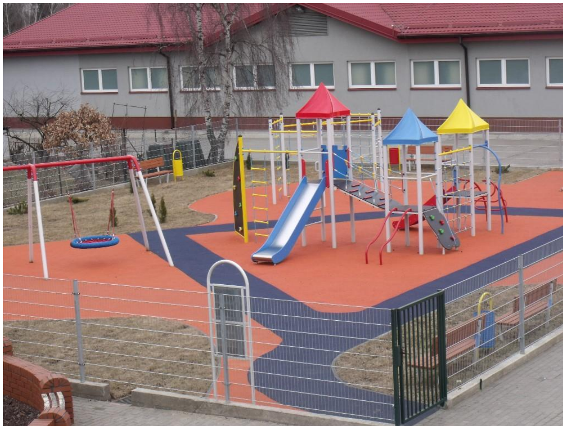
Zespół Szkół Nr 2 w Pułtusku