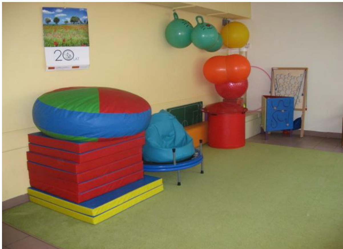
Szkoła Podstawowa nr 10 im. Jana Pawła II w Ostrołęce