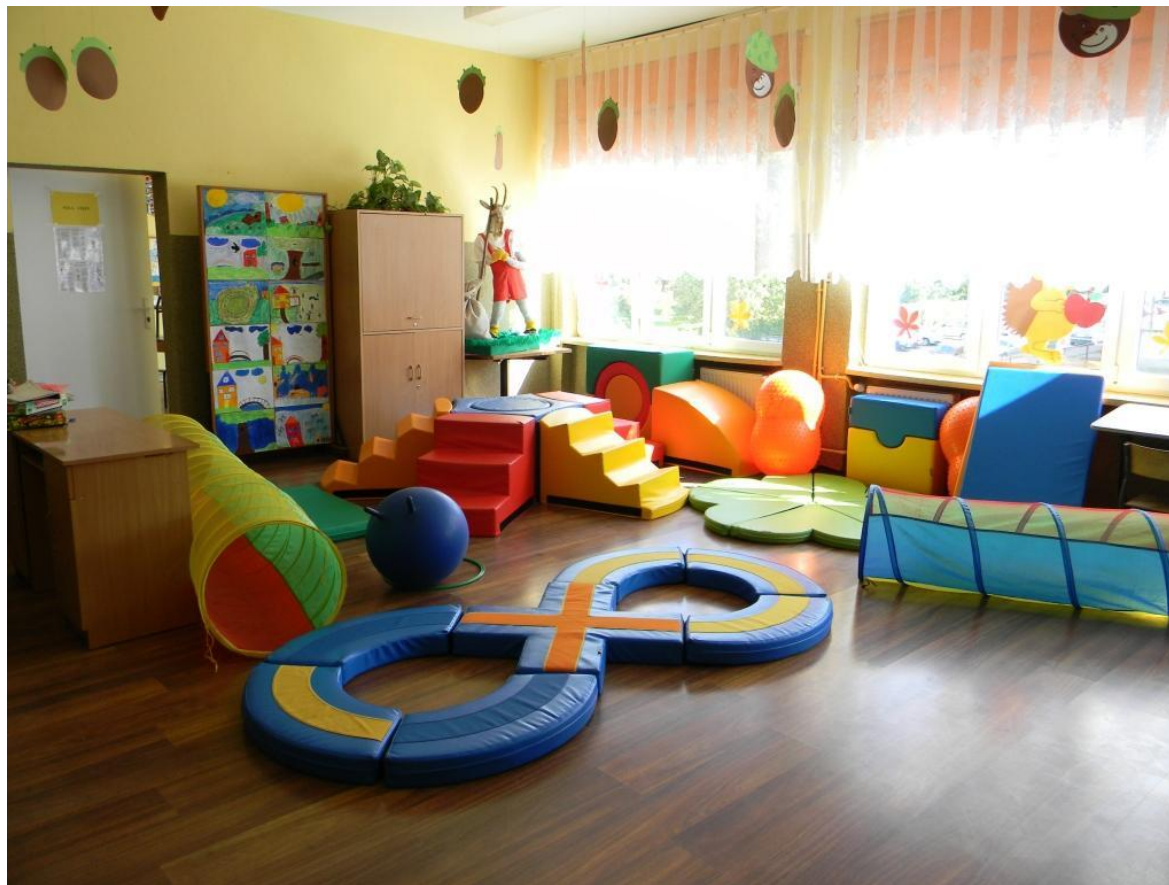
Szkoła Podstawowa Nr 3 im. Kornela Makuszyńskiego w Płocku