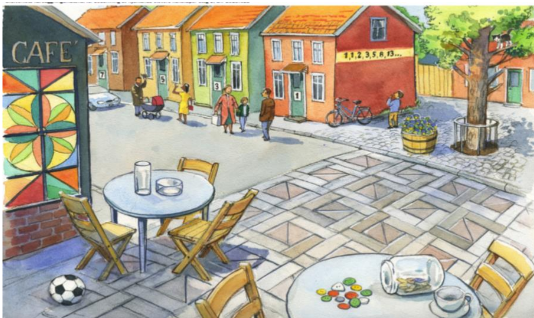
Rysunek będący podstawą rozmowy diagnozującej umiejętność matematycznego myślenia.

Proces diagnozy jest trzyetapowy , lecz jedynie dwa pierwsze etapy są obowiązkowe. Materiały w ramach procesu skonstruowane są w taki sposób, aby diagnozowanie umiejętności ( knowledge mapping ) mogło odbywać się w formie rozmów z uczniem. Są to rozmowy trwające nie dłużej niż 70 minut, wliczając czas na tłumaczenie. Długość rozmowy jest oczywiście regulowana i dostosowywana do wieku i możliwości ucznia. Etap pierwszy i drugi przewidują trzy takie rozmowy. Pierwsze spotkanie (etap 1) to wspólna rozmowa z uczniem i jego rodzicami/opiekunami podczas, której osoba diagnozująca koncentruje się na doświadczeniach i umiejętnościach językowych dziecka nabytych w kraju ojczystym oraz na jego odczuciach i oczekiwaniach w związku z rozpoczęciem nauki w nowym kraju . Pierwsze spotkanie to również doskonała okazja ku temu, by nawiązać pozytywny kontakt z uczniem, stworzyć dobry klimat pracy, który ułatwi przeprowadzenie kolejnych dwóch rozmów (etap 2) skupiających już się na umiejętności czytania i pisania ( litteracitet ) oraz umiejętności matematycznego myślenia ( numeracitet ).