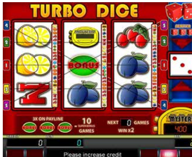
Przykładowy wygląd tzw. gry bębnowej