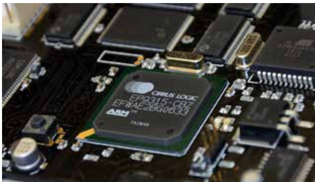
Generator liczb losowych

W przykładowej grze bębnowej przed rozpoczęciem gry gracz, za pomocą odpowiedniego przycisku, ustala stawkę za grę. Jednocześnie, wraz ze zmieniającą się stawką za grę, zmienia się tabela wygranych. Naciśnięcie przycisku uruchamiającego grę rozpoczyna grę – wizualizację obracających się bębnow z symbolami. Każda gra kończy się samoczynnym zatrzymaniem się bębnow. Gracz nie ma żadnej możliwości zatrzymania „bębnow”. To potwierdza, że wynik gry jest losowy, niezależny ani od jego woli ani od zręczności. Gracz nie ma wpływu na wybór symboli na bębnow. Tym samym nie ma wpływu na to, aby symbole ułożyły się w układ zapewniający wygraną. Nie ma także możliwości przewidywania układu symboli, jakie