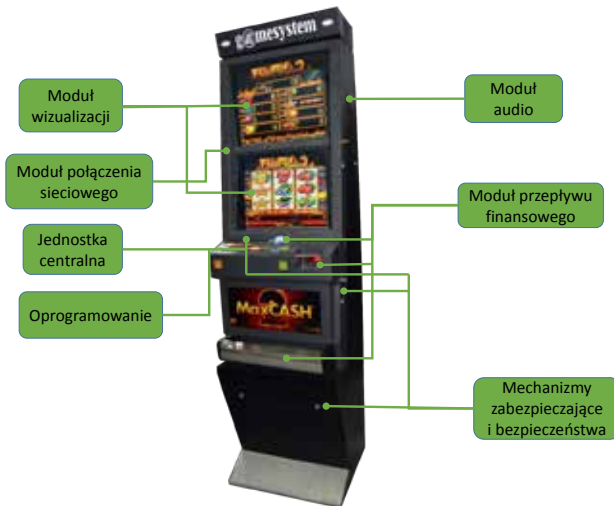
Widok zewnętrzny przykładowego automatu do urządzenia gier hazardowych

Wszystkie aspekty gry, począwszy od włożenia do automatu monety lub banknotu do ustalenia wyniku każdej gry, kontrolowane są przez technologie, w których RNG odrywa rolę najważniejszą. Dlatego właśnie wynik gry w najmniejszym