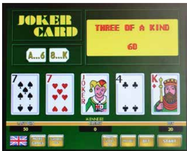
Przykładowy wygląd tzw. gry karcianej

wypadną w momencie zatrzymania kręcących się bębnow, co oznacza, że wyniki rozegranych gier zawsze pozostają dla niego nieprzewidywalne.