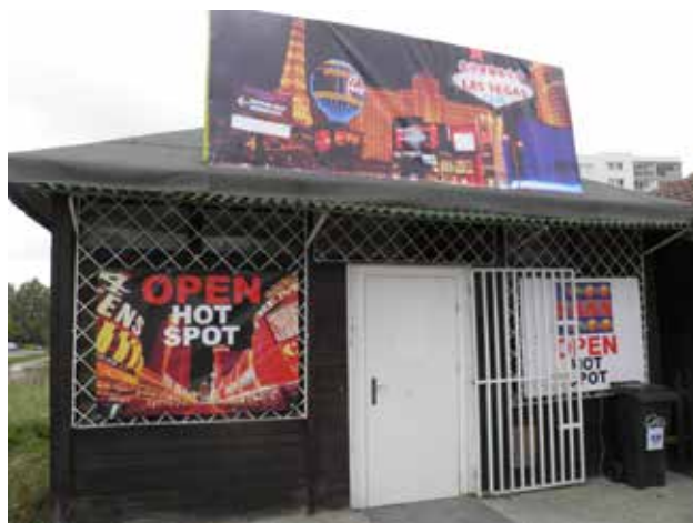
Pomorskie Las Vegas

Druga kontrola, tym razem przeprowadzona 30 września w Gdańsku, zakończyła się zajęciem trzech automatów o wartości 36 tysięcy zł. W obu przypadkach, nielegalny charakter urządzanych gier potwierdziły eksperymenty. Funkcjonariusze ustalili, że są one prowadzone bez wymaganego zezwolenia, natomiast zawierają element losowości, gracz ma szansę na wygrane rzeczowe. Dodatkowo oba lokale były oznaczone w sposób spełniający kryteria zabronionej reklamy gier hazardowych. Materiały z obu kontroli, w których uczestniczyli również funkcjonariusze Policji i CBS, trafiły do Referatu Dochodzeniowo-Śledczego oraz Referatu Akcyzy i Gier Urzędu Celnego w Gdańsku do dalszego postępowania.