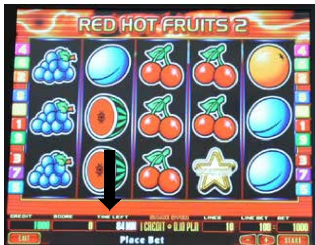
Przykładowa gra gdzie odmierzany jest czas.