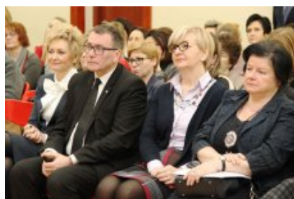
Wielkanocna Akcja Paczka 2018