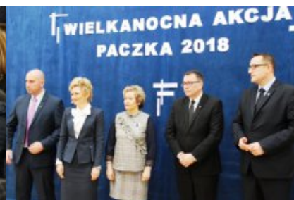
Wielkanocna Akcja Paczka 2018