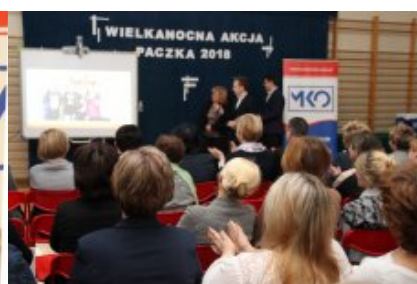
Wielkanocna Akcja Paczka 2018