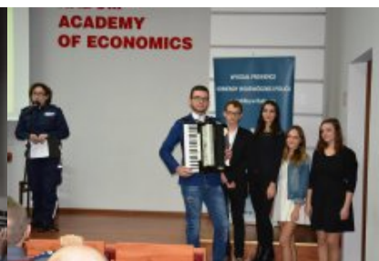
Przedstawienie profilaktyczne - absolwenci Publicznego Gimnazjum im. ks. Biskupa Jana Chrapka w Wierzbicy