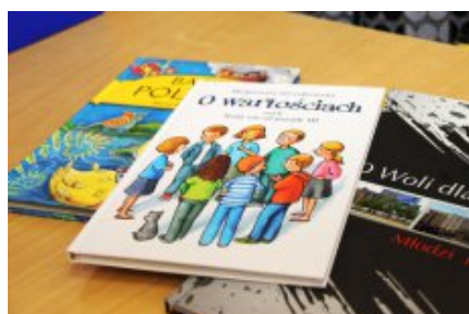
Spotkanie w Szkole Podstawowej nr 222 im. Jana Brzechwy w Warszawie