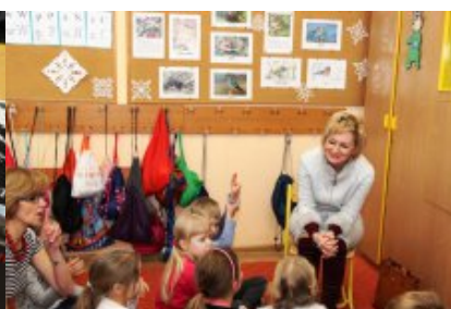
Spotkanie w Szkole Podstawowej nr 222 im. Jana Brzechwy w Warszawie