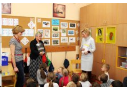
Spotkanie w Szkole Podstawowej nr 222 im. Jana Brzechwy w Warszawie