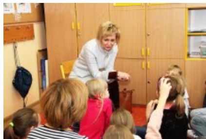
Spotkanie w Szkole Podstawowej nr 222 im. Jana Brzechwy w Warszawie