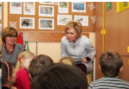
Spotkanie w Szkole Podstawowej nr 222 im. Jana Brzechwy w Warszawie