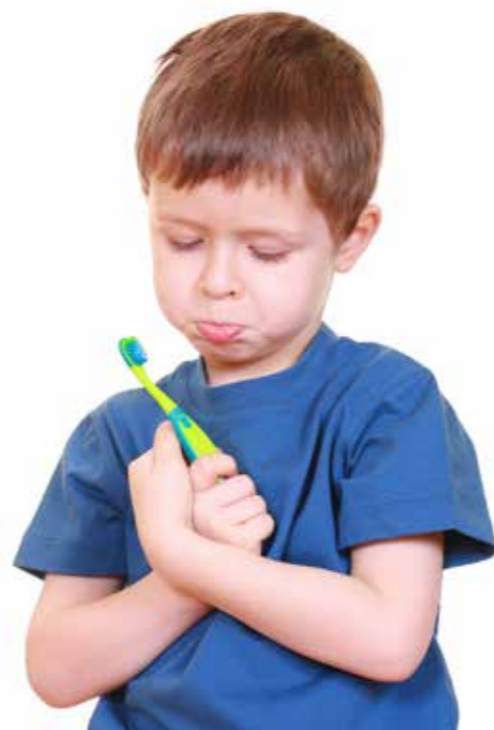
fol. Archiwum MKO