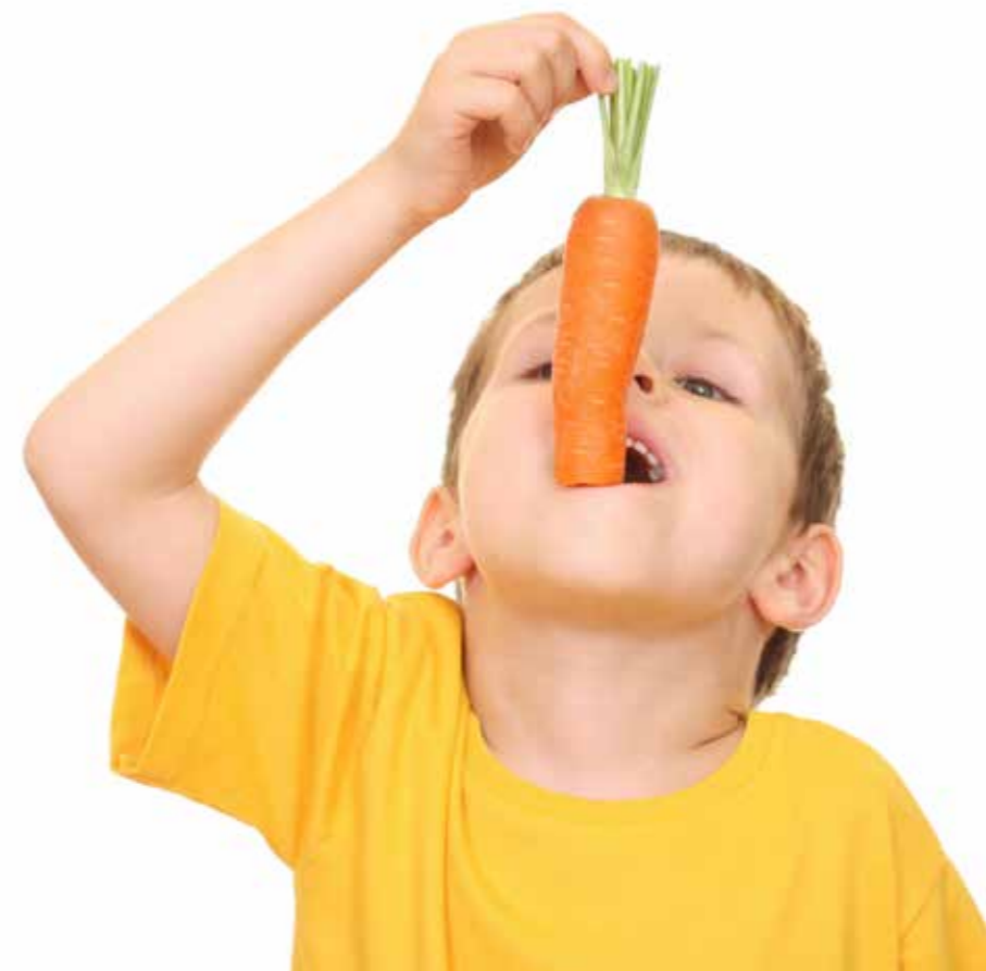
fol. Archiwum MKO

rze kładą największy nacisk na informacje z zakresu protezowania pacjentów. Istotnym punktem spotkań jest również rozmowa na temat chorób przyzębia, na które według przeprowadzonych badań cierpi około 40 proc. Polaków po 50. roku życia. Co więcej, organizowane są wykłady dla przedsiębiorstw, podczas których pracownicy w siedzibach swoich firm dowiadują się, jak skutecznie wykorzystywać komunikację niewerbalną w biznesie oraz jak ważną rolę odgrywa w niej zdrowy i piękny uśmiech. Spotkania prowadzi specjalista z zakresu sztuki autoprzedstawienia. Słuchacze mogą także skorzystać z porad personelu medycznego dotyczących właściwej pielęgnacji zębów.