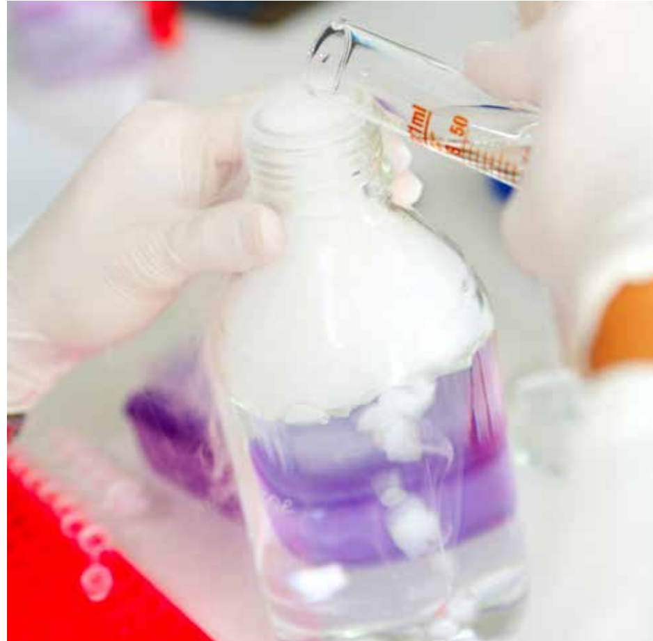
fol. Archiwum MKO

ci, w tym logicznego myślenia, współpracy w grupie, kształtowania dobrych nawyków cyfrowych oraz upowszechniania wiedzy na temat bezpiecznego korzystania z nowoczesnych technologii, a także rozwijania podstawowych funkcji poznawczych takich, jak pamięć, koncentracja uwagi, analiza, synteza wzrokowa i słuchowa, koordynacja ruchowa. Ponadto dzieci są przygotowywane do rozumienia elementarnych podstaw kodowania. Do osiągnięcia powyższych celów wykorzystywane są tablety i mata edukacyjna, które ufundowała firma Samsung Electronics Polska. Zajęcia realizowane są od września 2015 r., trzy razy w tygodniu w grupie badawczej, tj. dla dzieci 5-letnich z grupy „Kotków” oraz raz w miesiącu w pozostałych grupach.