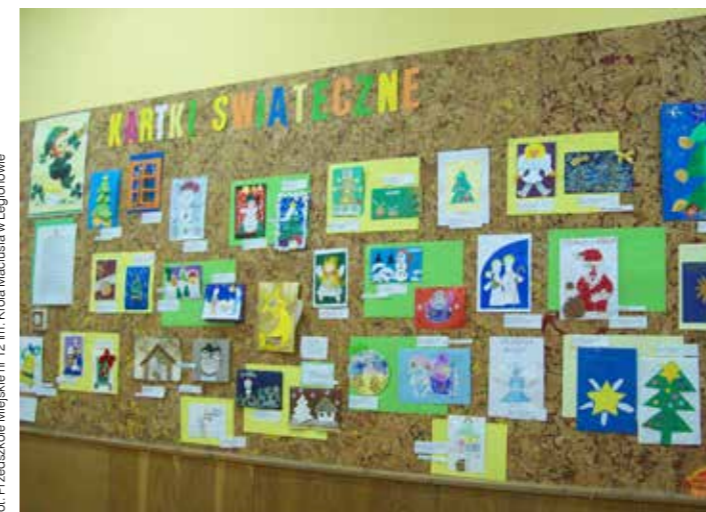
Nasze konkursy – „Najpiękniejsze kartki świąteczne”

W ramach programu „Poczytaj mi mamo, poczytaj mi tato – przygoda z książką” w grudniu dominuje tematyka świąteczna. Niekiedy przyjmuje formę mini spektaklu, w który zaangażowane są dzieci i rodzice. Do szczególnie pięknie zaprezentowanych i poruszających serca widzów zaliczam „Wigilię dla zwierząt” - imprezę charytatywną, z której dochód pozwolił ufundować paczki świąteczne dla kilkunastu dzieci z niezamożnych rodzin (hojność rodziców w takich sytu-