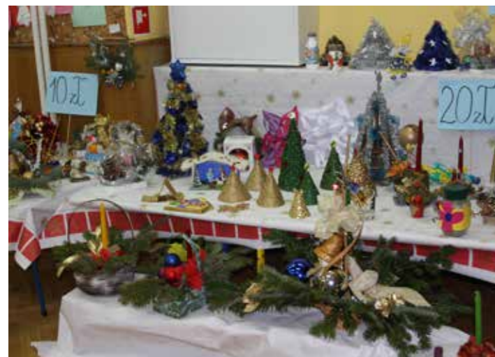
Kiermasz ozdób świątecznych

Liczne grudniowe działania, towarzyszący nastrój, wywołane emocje kształtują wrażliwość naszych wychowanków, wzbogacają wiedzę o tradycjach Świąt Bożego Narodzenia i dają nadzieję, że będą kultywowane w ich przyszłych rodzinach. □