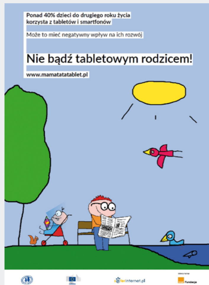
Materiały: Fundacja Dzieci Niezysłe