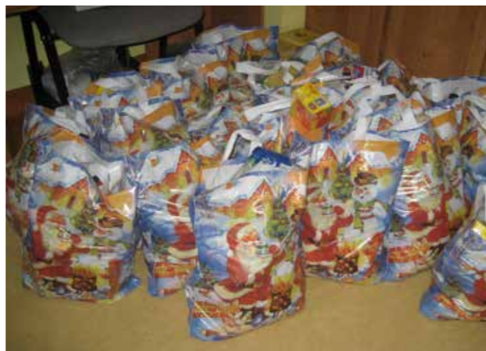
Paczki dla dzieci z rodzin niezamożnych

Kiedyś to się dzieci biło, ale to był błąd. Strach to nie jest sposób na wychowanie.