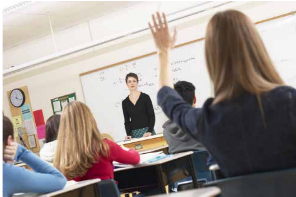
fol. Archiwum MKO

Jak podał Ośrodek Rozwoju Edukacji platforma epodreczniki.pl odnotowała 14 milionów wejść. W serwisie jest już dostępny komplet e-podreczników – interaktywnych, multimedialnych, wyposażonych w ćwiczenia. Na platformie znajdują się także zasoby dodatkowe: wirtualne wycieczki, multimedia, scenariusze lekcji, poradniki dla nauczycieli. W katalogu Zasobów Dodatkowych jest ich ponad 3 tysiące. Pozostałe zostały podpisane bezpośrednio do e-podreczników, żeby ułatwić prowadzenie lekcji. Do podręczników edukacji wczesnoszkolnej dołączono 700 kart pracy, gry dydaktyczne i słuchowiska. W e-podręcznikach do klas wyższych dostępne są aplikacje – ścieżki dydaktyczne „Baw się i ucz”, „Pomyśl i działaj”, zaś w edukacji gimnazjalnej – zeszyt „WOS – projekty, warsztaty, debaty”, który jest zbiorem propozycji wspólnej pracy dla uczniów, wyposażonym w materiały filmowe, ilustrujące najważniejsze zagadnienia i wydarzenia historii najnowszej.