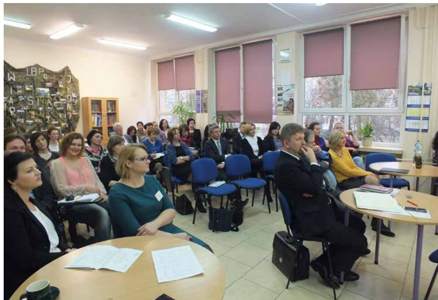
Uczestnicy Inauguracji Powiatowego Centrum Doradztwa Zawodowego w Wyszkowie

W schemacie organizacyjnym Centrum można wyróżnić następujące jednostki: