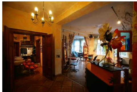
Salon Fryzjerski De Legge w Opolu