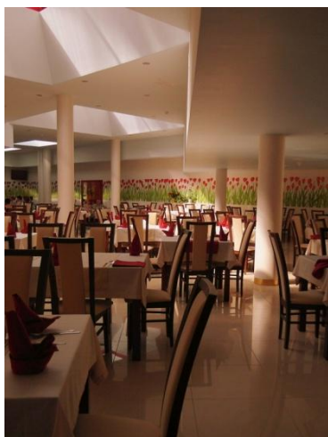
Uzdrowisko Uniejów Park w Uniejowie

Praktyki/staże dla nauczycieli z branży gastronomicznej to niepowtarzalna okazja, by „od kuchni” poznać pracę w ogólnodostępnej restauracji, specjalizującej się w wybranej kuchni świata, która wykorzystuje nowoczesne technologie przygotowywania potraw. To ponadto możliwość zapoznania się z nowoczesnym wyposażeniem wykorzystywanym w codziennej pracy w branży gastronomicznej oraz możliwość poznania tajników branży, dzięki rozmowom z zatrudnionymi ekspertami.