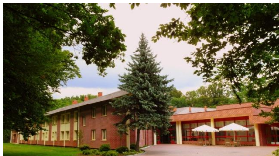
Uzdrowisko Uniejów Park w Uniejowie www.izc.pl/uniejow

Dla nauczycieli z branży hotelarskiej praktyki/staże to możliwość zapoznania się z funkcjonowaniem obiektu posiadającego co najmniej 30 pokoi hotelowych wraz z ogólnodostępną restauracją oraz świadczącego usługi SPA i Wellnes. Dodatkowo szansa poznania systemów informatycznych wykorzystywanych w zarządzaniu nowoczesnym obiektem, który przez cały rok odwiedzają turyści z Polski i z zagranicy, i który posiada ich wysokie rekomendacje.