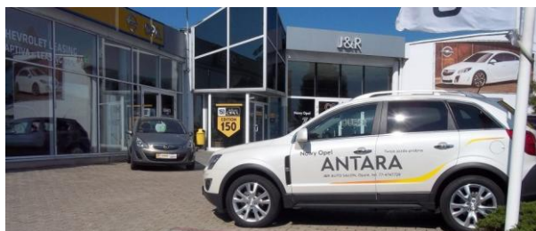
Janus&Rusnak Auto-Salon w Opolu www.j-r.opole.pl