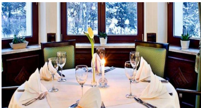
Hotel Bukowy Park**** w Polanicy Zdroju