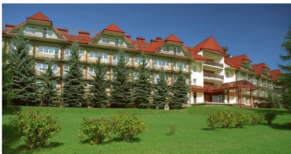
Uzdrowisko Wysowa nad Parkiem w Wysowej Zdroju www.bukowypark.eu