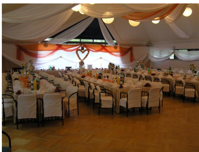
Uzdrowisko Wysowa nad Parkiem