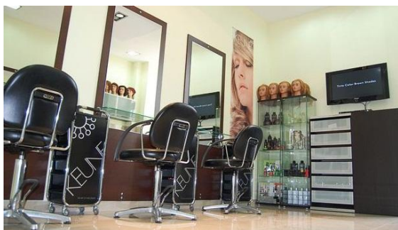
Studio Fryzjerskie Rychter w Łodzi