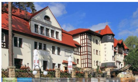
Hotel Bukowy Park w Polanicy Zdroju www.bukowypark.eu

Dla nauczycieli z branży hotelarskiej praktyki/staże to możliwość zapoznania się z funkcjonowaniem obiektu posiadającego co najmniej 30 pokoi hotelowych wraz z ogólnodostępną restauracją oraz świadczącego usługi SPA i Wellnes. Dodatkowo szansa poznania systemów informatycznych wykorzystywanych w zarządzaniu nowoczesnym obiektem, który przez cały rok odwiedzają turyści z Polski i z zagranicy, i który posiada ich wysokie rekomendacje.