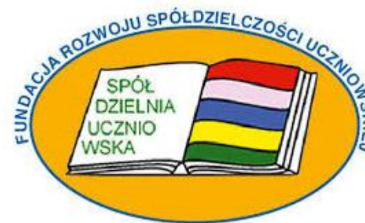
Fundacja Rozwoju Spółdzielczości Uczniowskiej