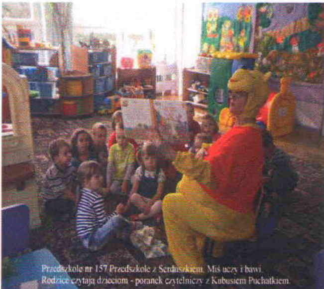
Przedszkole nr 157 Przedszkole z Serduszkciem. Miś uczy i bawi. Rodzice czytają dzieciom - poranek czytelniczy z Kubusiem Puchatkiem.