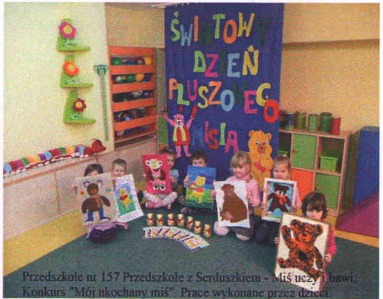
Przedszkole nr 157 Przedszkole z Serduszkciem - Miś uczy i bawi. Konkurs "Mój ukochany miś". Prace wykonane przez dzieci.